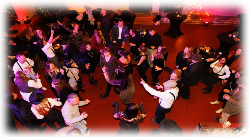
Teamfeest december 2022: In de Koepel gevangen

Het verzuimpercentage was in 2022 (8,9%) aanzienlijk hoger dan in 2021 (3,4%). Dit beeld zien we bij andere zorgorganisaties en in de landelijke cijfers ook terug. De samenwerking tussen BEZIG en Plushome is geïnteresseerd op het gebruik van het verzuimsignaal en specialistische vragen m.b.t. aanpak verzuim. Binnen Plushome is er een verzuim coördinator die het proces van re-integratie monitort en in de gaten houdt.